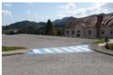
Označen prehod za pešce