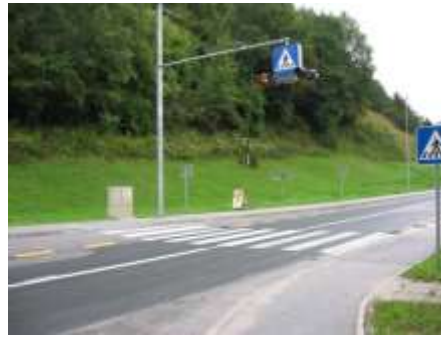
Nevaren prehod za pešce v Opoki; slaba vidljivost pešcev v jutranjem času ali slabih vremenskih razmerah