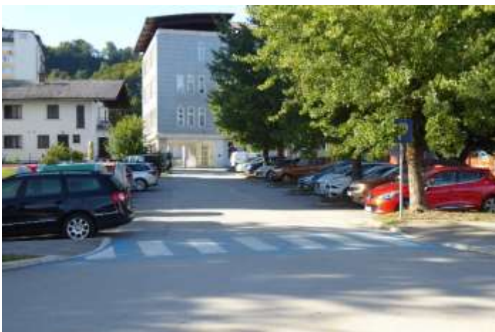
Dovoz k šoli – obvezna smer naravnost