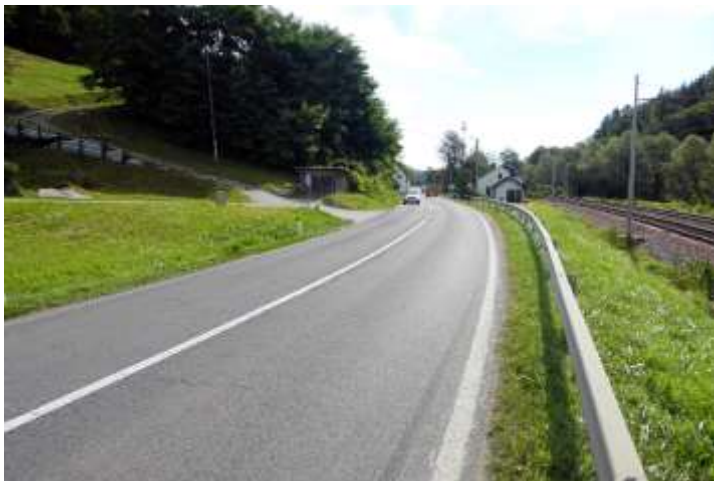
Nevaren odsek brez površin za pešce pri zaselku Loke