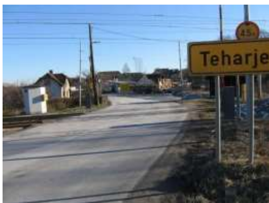
Železniški prehod Teharje