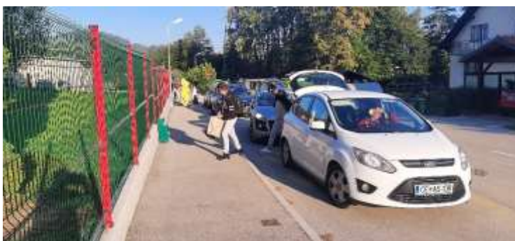
Zgoščen promet v jutranjih urah