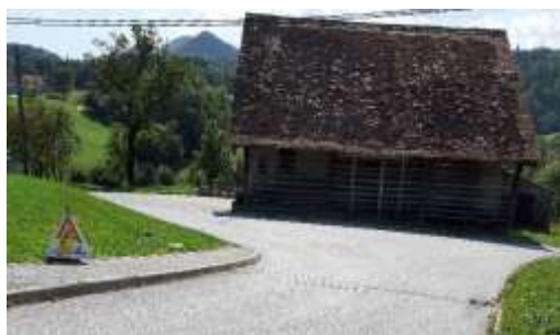
Nevaren odsek brez površin za pešce