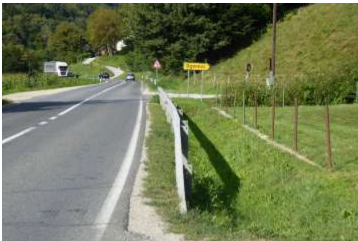
Prometna cesta pri odcepu za Ogorevc